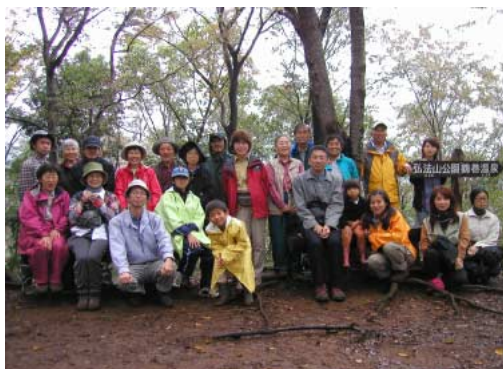
東京蜘蛛談話会 10 月採集会参加者一同