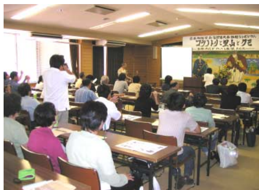
シンポジウムのひとこま

午後の総会が終わったあとは一大イベントであるシンポジウムが開催されました。コウノト