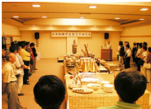
懇親会のひとこま

ということで無事37回大会が終了したわけですが、一言で総括しますと非常に充実した大会だった気がします。その理由としてまず目的が明確かつ内容が分かりやすい発表が多かったことと、もう一つは行動生態学、生活史進化から、生理生態、分類、さらには保全などテーマがバラエティーに富んでいたことでしょうか。内容の充実度を反映してか、昨年と比べて議論も活発だった印象も受けました。今回の大会であえて不満だった点を一つ挙げますと、会場の設営や学会発表時も含め全般的に不備な部分が多かったことでしょうか。発表時に聴衆が照明やタイムキーパーを行う場面もありましたし・・・主催者の方々は開催のため苦労されたとは思いますが、事前の準備も含めもう少し