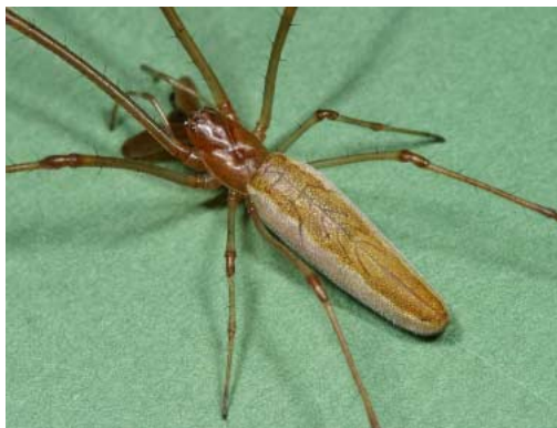
ヒカリアシナガグモ