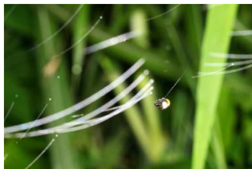
シロオビトリノフンダマシの網

それでも私には引っかかるものがあった．それは，トリフンが網を張る日と張らない日があ