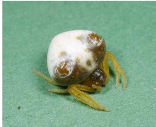
トリノフンダマシ

では、高湿度下で網を張る理由は何なのだろうか？ カルタンさんの結果では、湿度に関係なく粘性は低下するのではなかったのか。いや待てよ。彼女の実験は、確かに糸を入れたフィルムケースの中につぶり水を含んだティッシュを入れていたが、粘着力を測る際にはそこから糸を取り出して外気(湿度はたぶん高くない)のなかで測定していた。つまり、測定時の湿度は未調節であったし、またケースのふたを開ける際に、その都度ケース内には外気が入り込んでいたはずである。こうした操作上の問題を解消するには、部屋ごと高湿度にした空間で粘着力を測定する必要がある。ただ、トリフンを飼育下で網を張らせるのは困難なので、フレッシュな糸を得るためには、大学ではなく調査地の近くで実験をしなくてはならない。「部屋ごと高湿度にした空間」など滑川町にあるはずもない。でも、ないなら自分たちで作ればいい。私