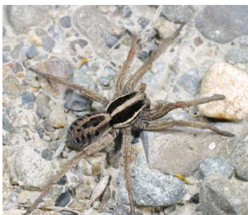
スズキコモリグモ