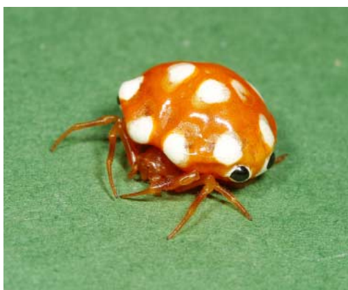
サカグチトリノフンダマシ