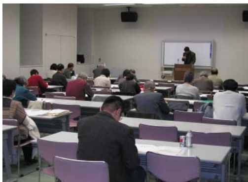
中部蜘蛛懇談会研究会のひとつま