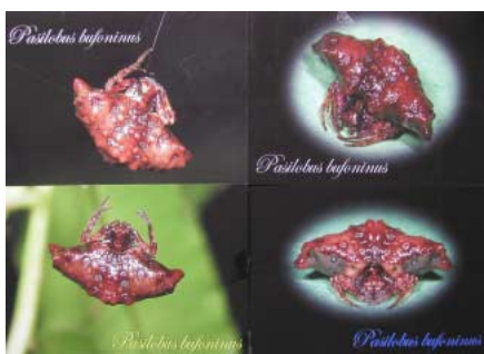
絵葉書（実際には5枚1セットです）